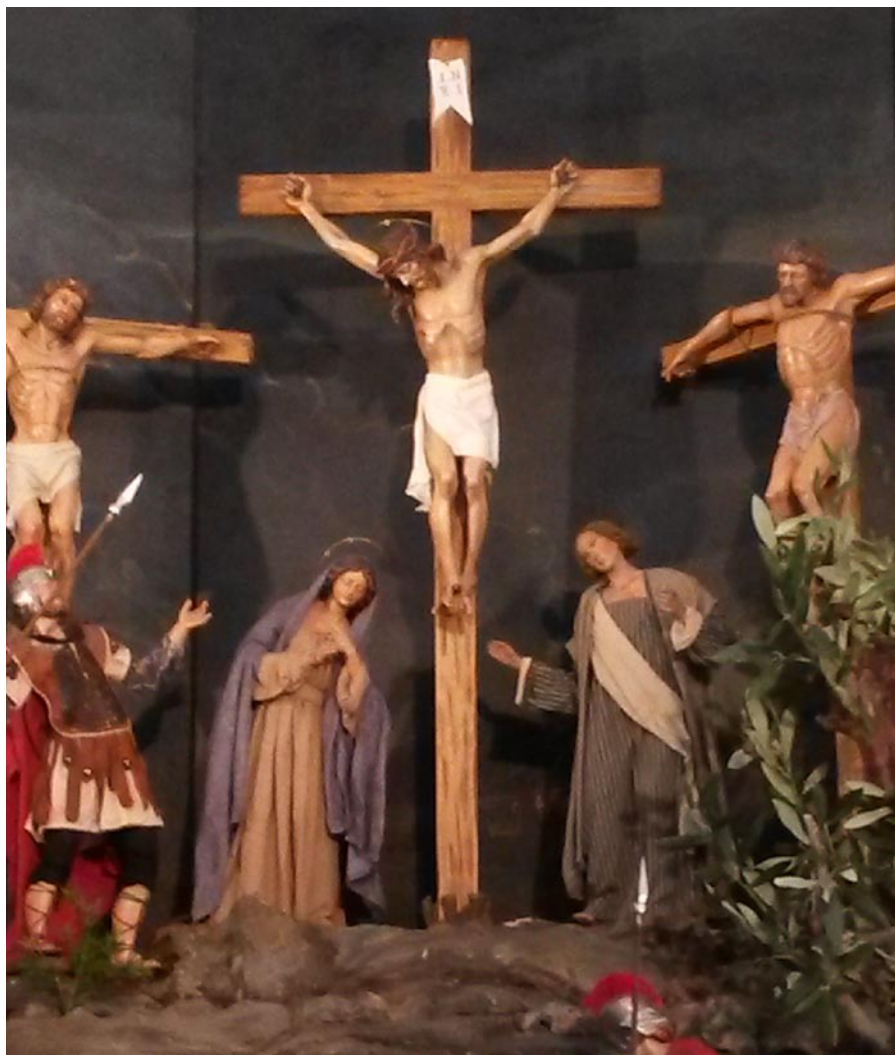
Ausschnitt aus der Fastenrippe im Romedikirchl Thaur