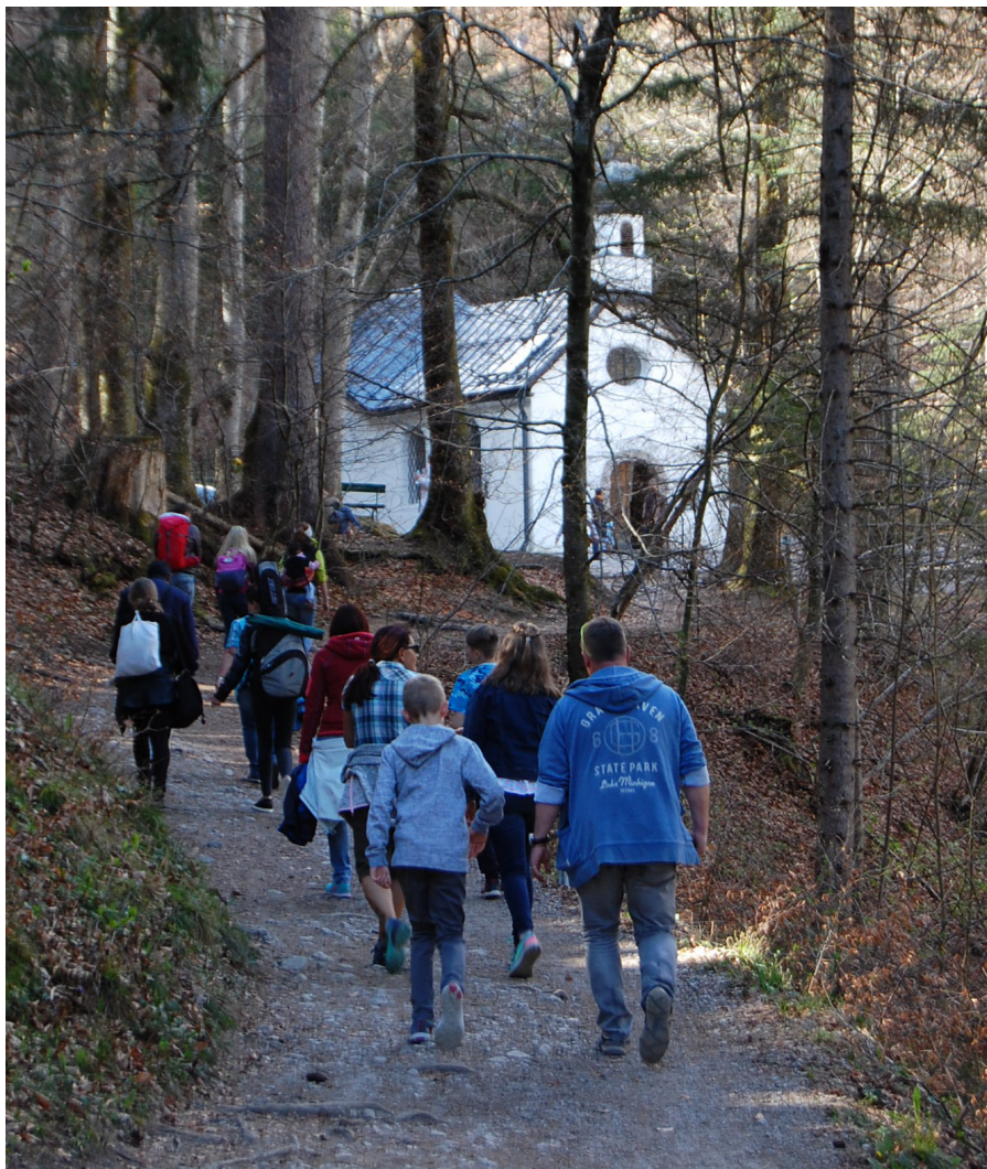
Wallfahrt mit den Firmlingen aufs Höttinger Bild