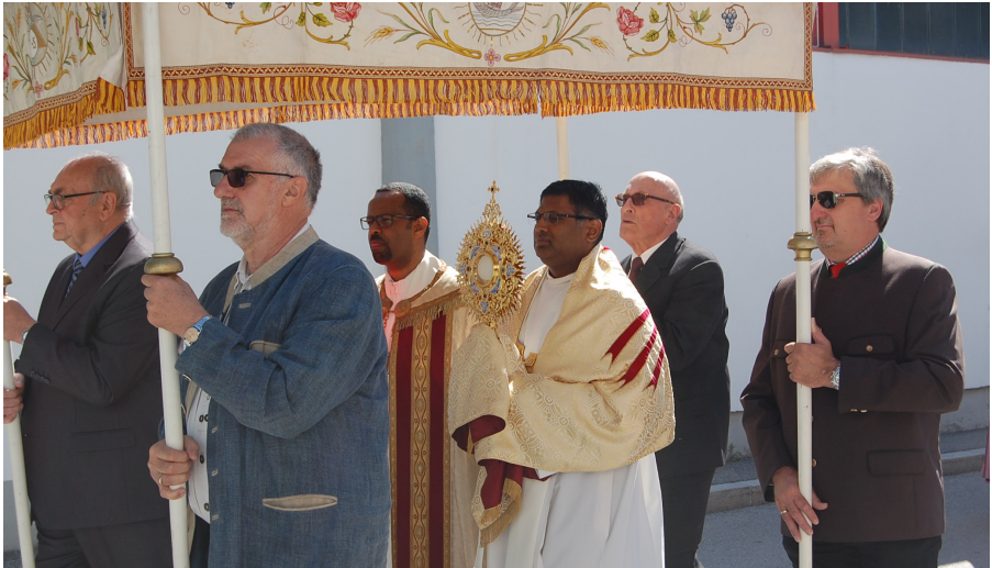
Fronleichnamsprozession im Sieglanger