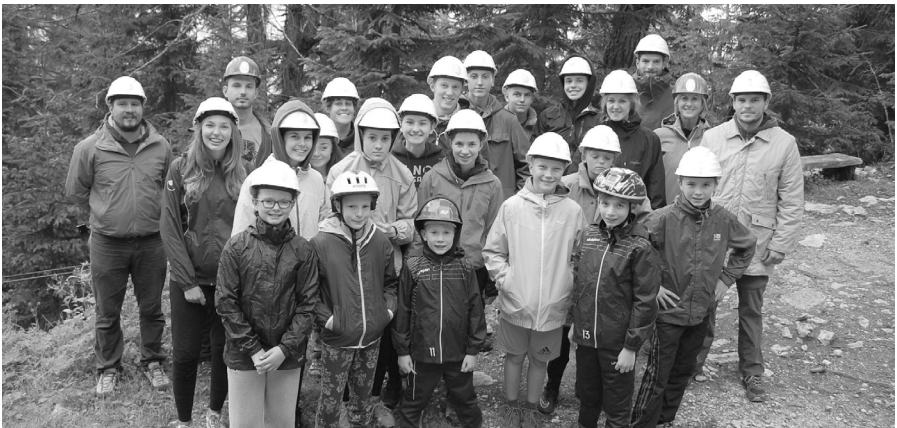
Jetzt geht's in die Eishöhle

Wie im Jahr zuvor war Montag Wandertag, diesmal zur Buchackeralm. Oben angekommen gab es Schnitzelsemmel als Jause, die unser super Küchenteam vorbereitet hatte. Wer mochte, konnte mit fünf Betreuern weiter zur Hundalm Eishöhle wandern, der einzigen Eishöhle Tirols. Am Abend hatten wir unser erstes Lagerfeuer.