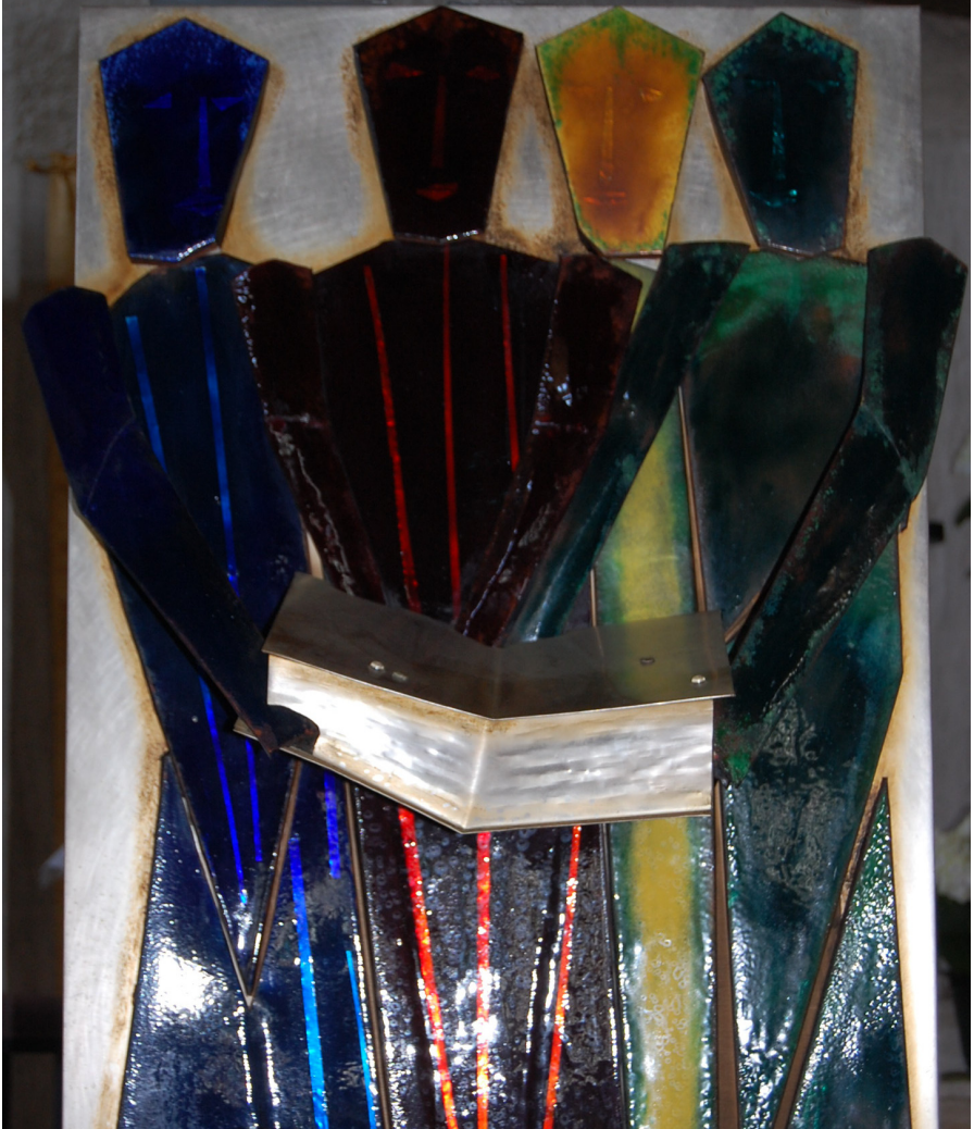
Ambo in der Pfarrkirche Maria am Gestade