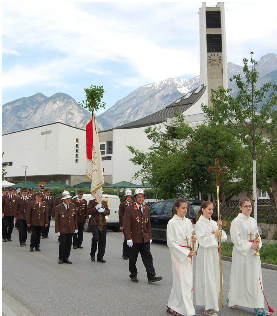
Fronleichnam - Hochfest des Leibes und Blutes Christi