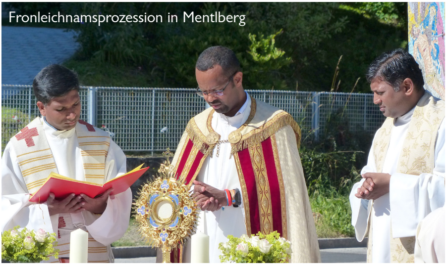
Fronleichnamsprozession in Mentlberg