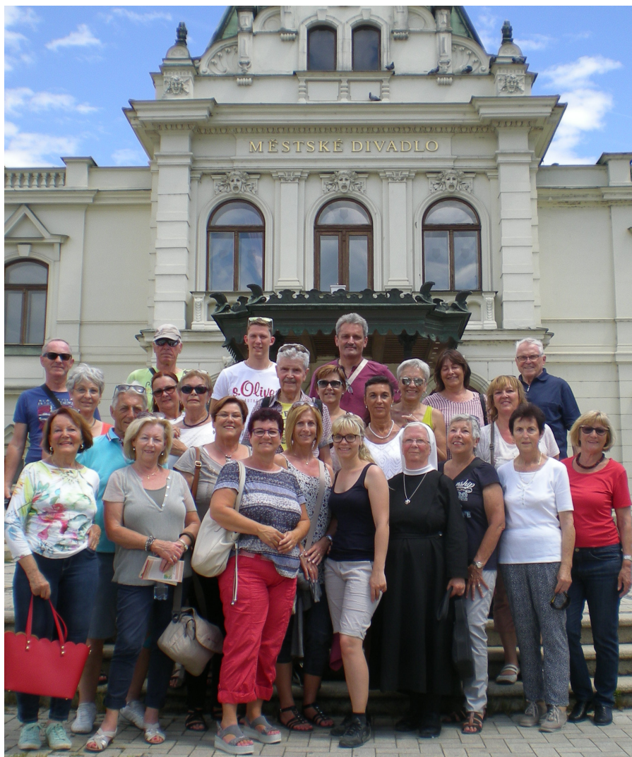
Pfarrausflug nach Südmähren

Jahrgang 40 | Nr. 428 | Juli und August 2017