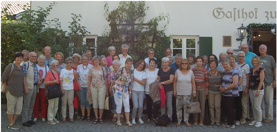
Hoangertstubmausflug zum Staffelsee