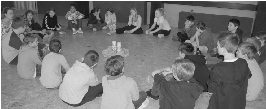
Firmwochenende Feber 2020

Generalvikar Roland Buemberger gespendet.