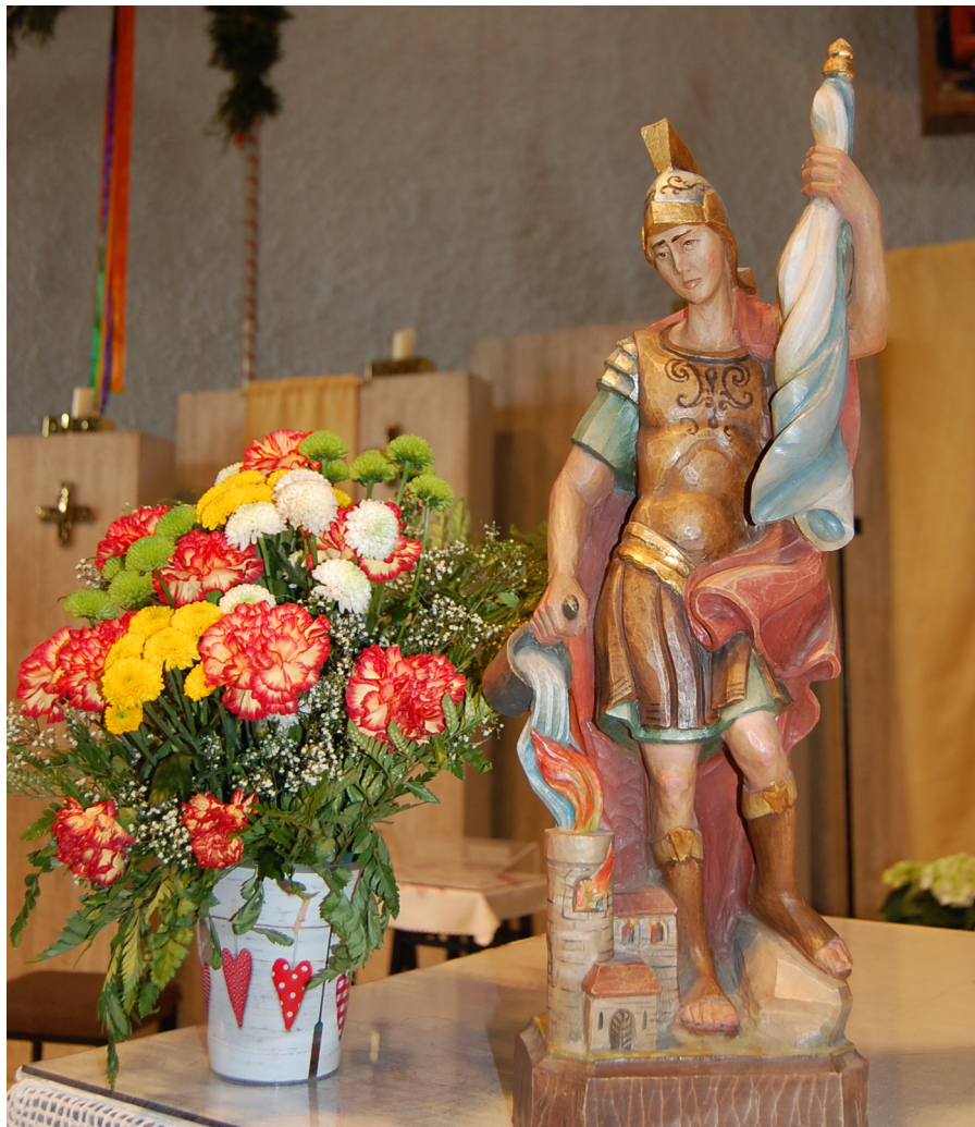
Heiliger Florian - Schutzpatron der Feuerwehr