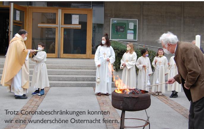
Trotz Coronabeschränkungen konnten wir eine wunderschöne Osternacht feiern.