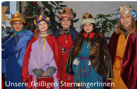
Unsere fleißigen SternsingerInnen