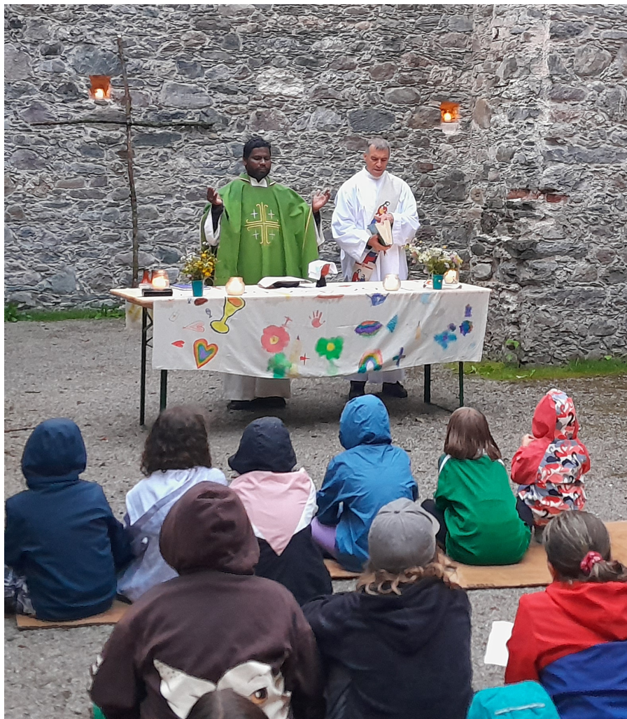
Heilige Messe im Ferienlager in der Kirchenruine Hörbrunn