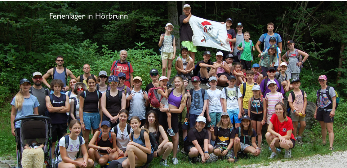
Ferienlager in Hörbrunn