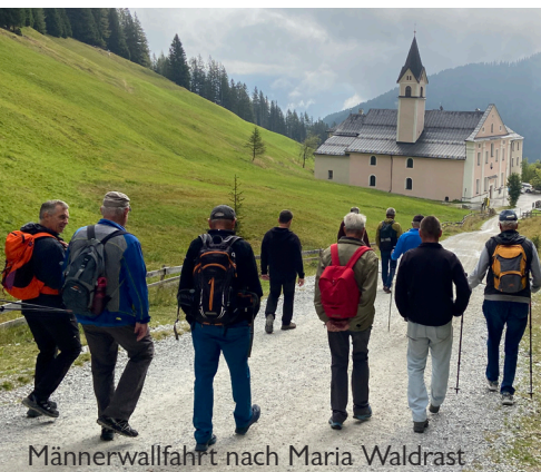
Männerwallfahrt nach Maria Waldrast